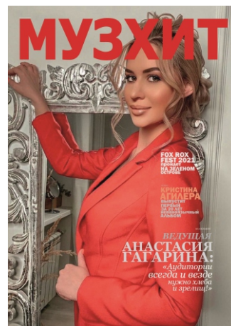
Фото с обложки: