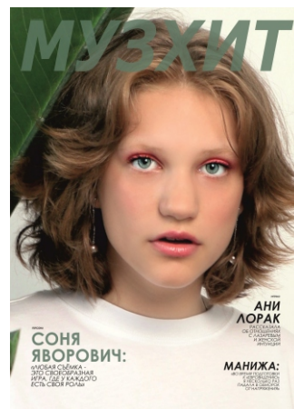
Фото с обложки: